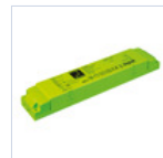
19367 INV P&L LED SE/SA 1H 60-180V