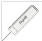
15037 MODULO LGFM