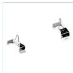
201954000 KIT 2 GANCI SOSPEN ST EASY LED