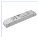
19398 INV UNIV AT RM 5W 20-240V