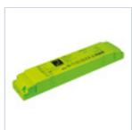
19371 INV P&L LED SE/SA 3H 60-180V