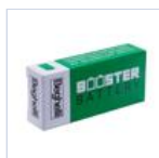
RA13 BOOSTER BAT LiFe 6.4V 1.5Ah