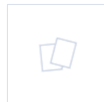
15080 MODULO DALI SLIM