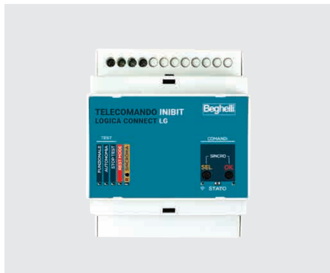
ŘÍDICÍ JEDNOTKA LOGICA INIBIT