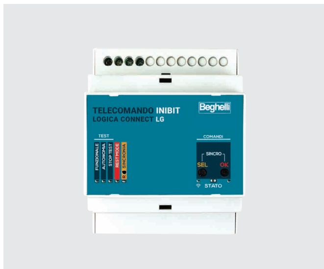
ŘÍDICÍ JEDNOTKA LG / LG INIBIT REMOTE CONTROL