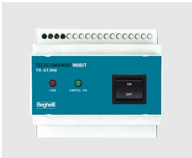
ŘÍDICÍ JEDNOTKA INIBIT RM / RM INIBIT REMOTE CONTROL