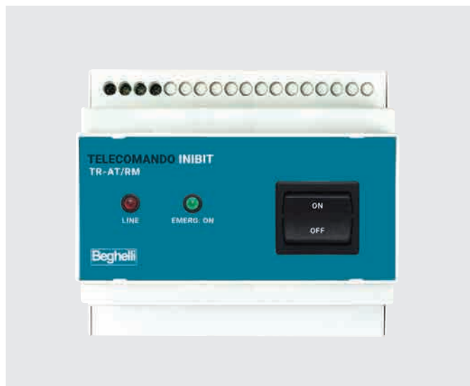
ŘÍDICÍ JEDNOTKA INIBIT