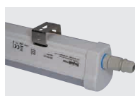
UPEVŇOVACÍ KONZOLY FIXING BRACKETS