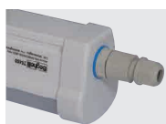
KABELOVÁ PRŮCHODKA PG13.5 PG13.5 CABLE GLAND